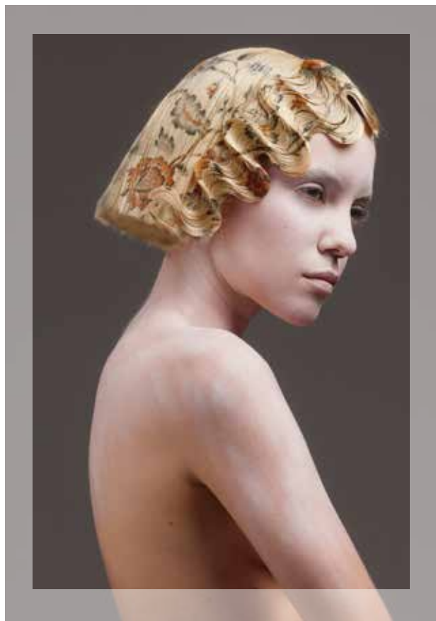
© Hair: Alexis Ferrer - Photography: Rafa Andreu

De startersdagen zijn gratis en toegankelijk voor iedereen die binnenkort zal starten in de sector. Wegens groot succes is snel inschrijven de boodschap! Inschrijven kan via de nieuwsbrief die verstuurd zal worden in oktober.