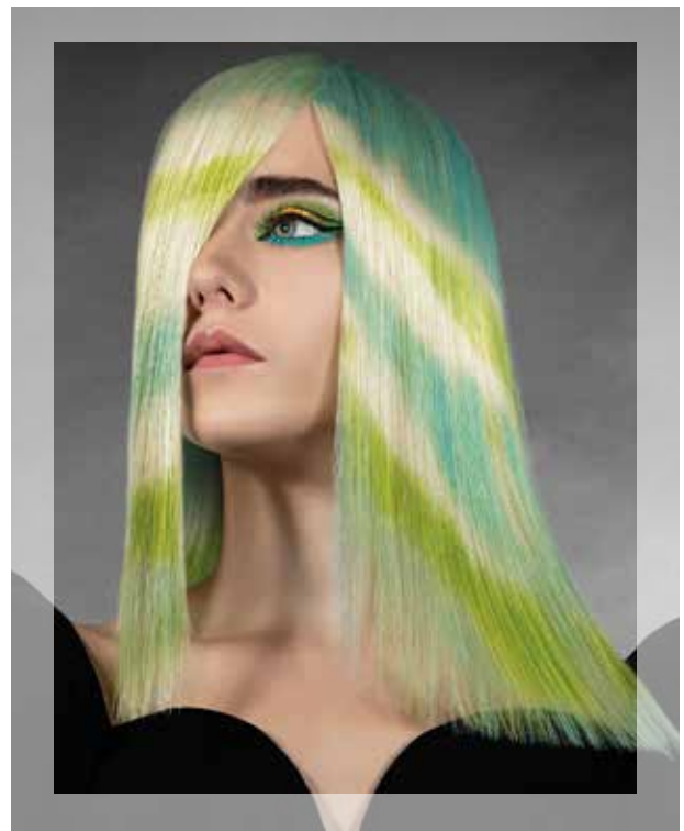
© Hair: Raquel Saiz

Nood aan een opleiding op maat bij jou op school? Laat ons weten welk onderwerp je graag wil behandelen en wij zorgen voor een opleider die bij jullie langskomt. Of het nu een basissnitcursus, brushing, opsteektechnieken, herensnit of de laatste nieuwe trends is: voor elk thema kan je bij ons terecht. Surf naar onze website en vul het aanvraagformulier in. Wij voorzien een opleider die jullie een leerrijke dag bezorgt.