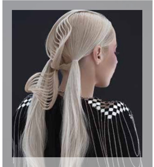
© Hair: Rafael Bueno