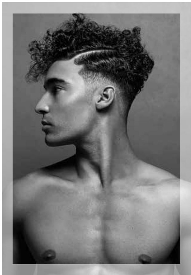
© Hair: Christian Rios - Photography: Esteban Roca