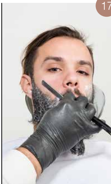
Bepaal de omtrek van de wangen met een scheermes