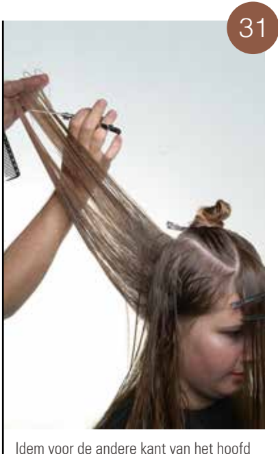
Idem voor de andere kant van het hoofd