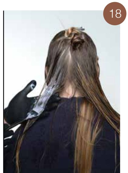
Semipermanente kleurmengeling: 10/7 + oxidant 1,5%. Breng de mengeling aan op de ontkleurde lokken