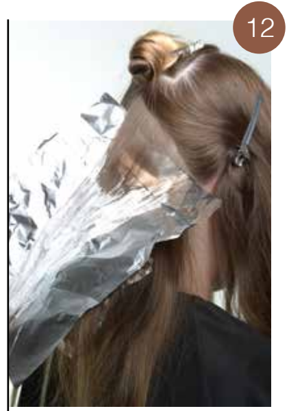
Breng de ontkleuringsmengelingen aan in de richting van beide zijanten