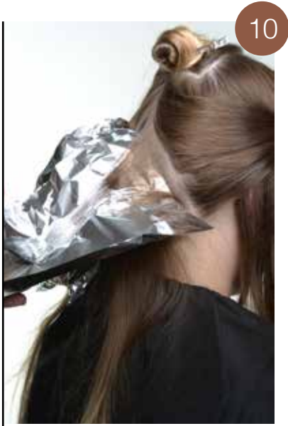
Behoud de diagonale lijn in de verdelingen en de stroken