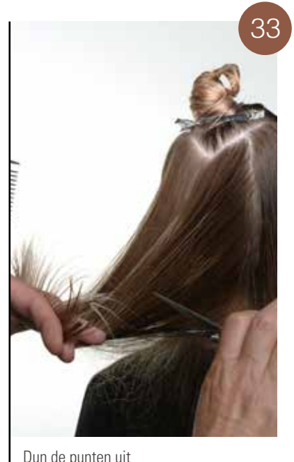
Dun de punten uit