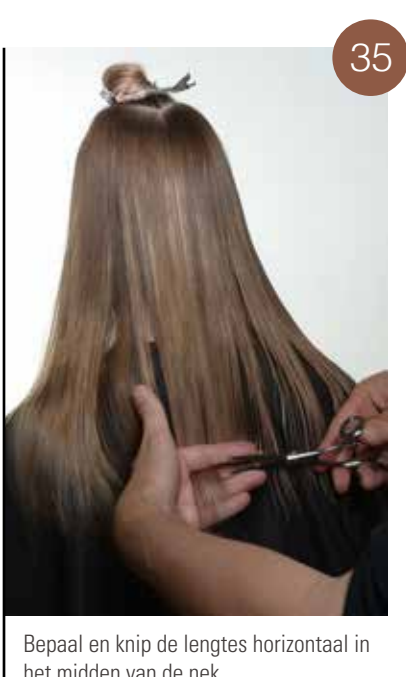
Bepaal en knip de lengtes horizontaal in het midden van de nek