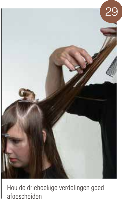
Hou de driehoekige verdelingen goed afgescheiden