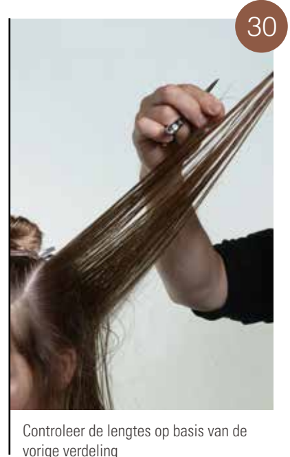
Controleer de lengtes op basis van de vorige verdeling