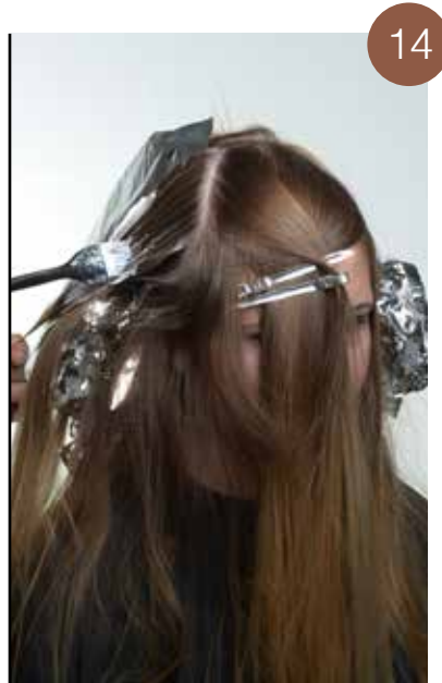
Neem diagonale verdelingen