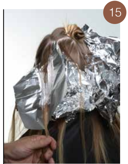
Hou de 2 driehoekige verdelingen bovenaan het hoofd goed gescheiden. Breng de ontkleurung aan op de andere kant van het hoofd