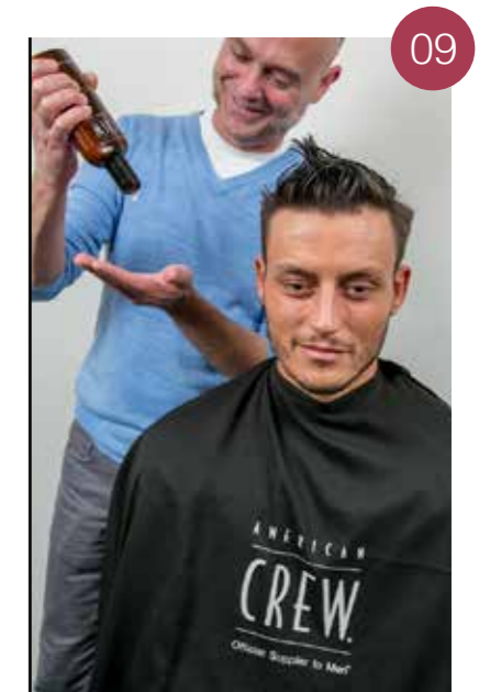
Scheer de achterkant op