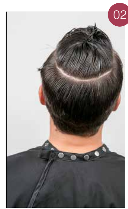
Trek een scheiding in hoefijzervorm op de kruin