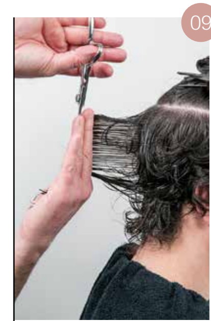
Herhaal verticaal van haarlok tot haarlok