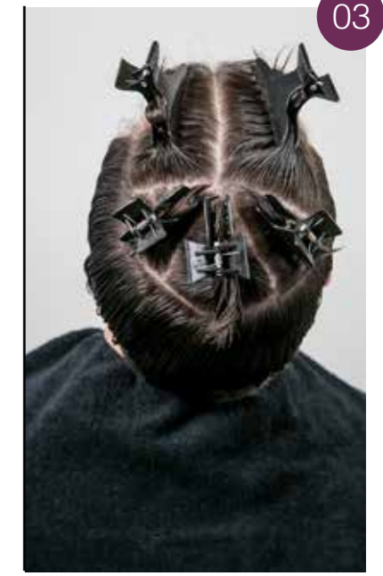
Splits deze zone op in 5 verdelingen