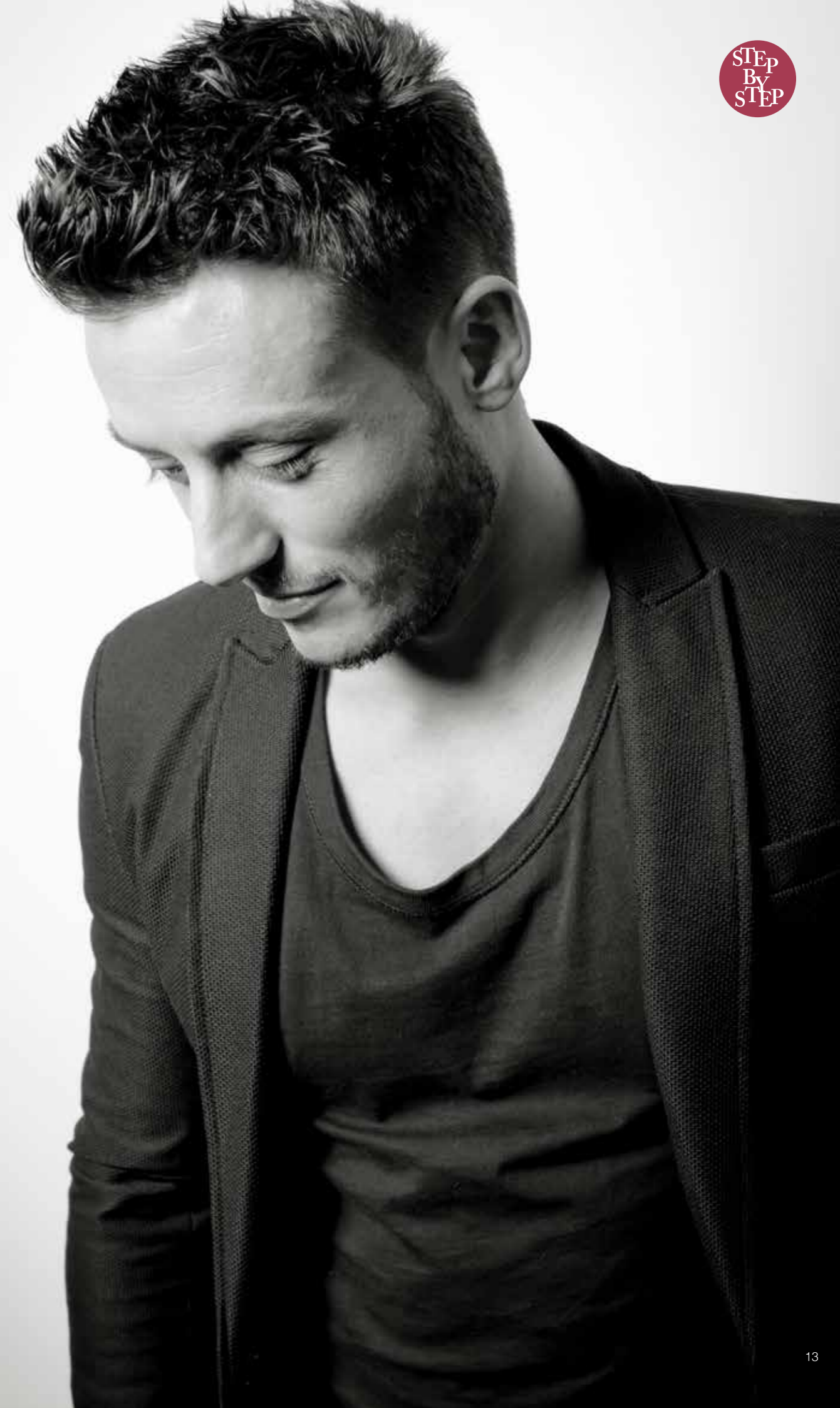
Gebruik de feather voor een warrig effect op de kruin