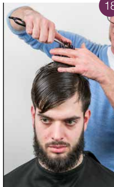
Zorg voor evenwicht bovenaan het hoofd door de puntjes bij te werken