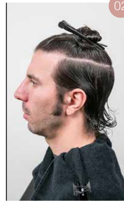
Trek een scheiding in hoefijzervorm op de kruin