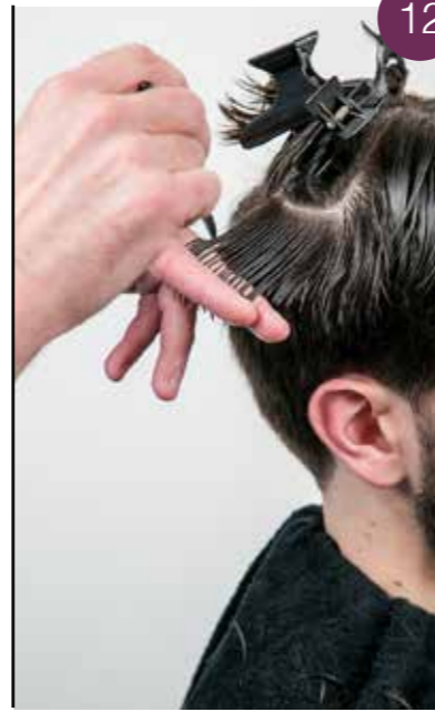
Leg de te knippen lok op de geknipte lok