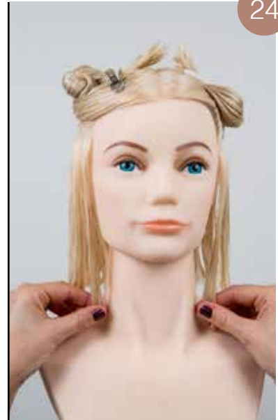
Kijk of de lengtes in evenwicht zijn