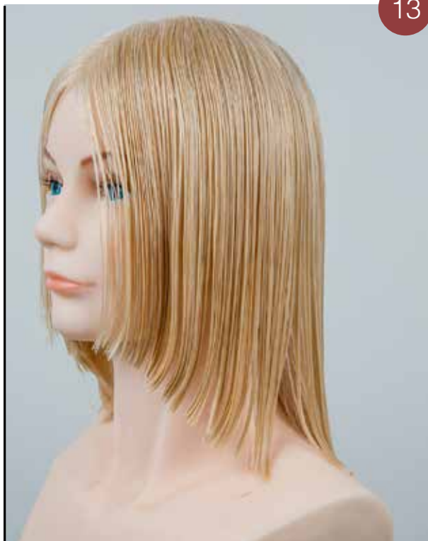
Kijk of de lengtes in evenwicht zijn