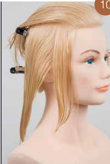
Knip loodrecht in 90° op de hoofdhuid op basis van de gidslijn op de kruin