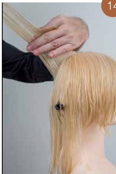
Herhaal dit voor de volumezone en hou rekening met de vorm van het hoofd