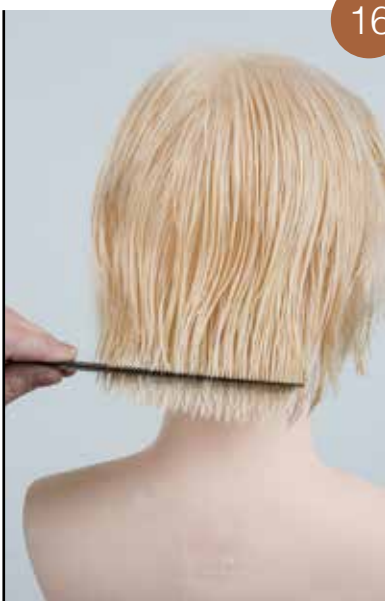
Bepaal de contouren