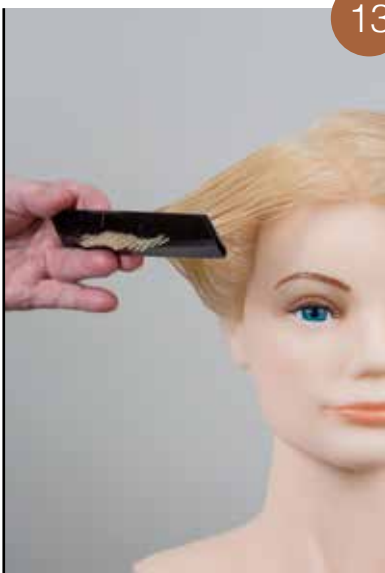
Controleer met een kruis controle of de snit in evenwicht is