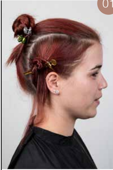
Deel het haar midden op het hoofd af vanaf de kruin tot de nek