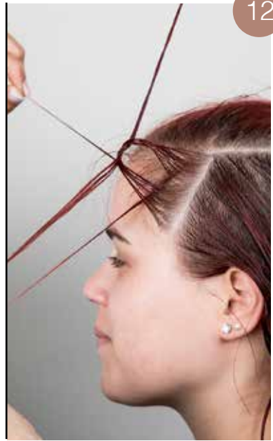
Deel de resterende lokken af