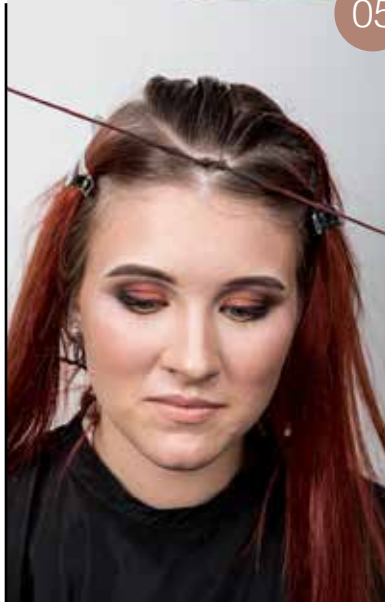
Span de knoop aan