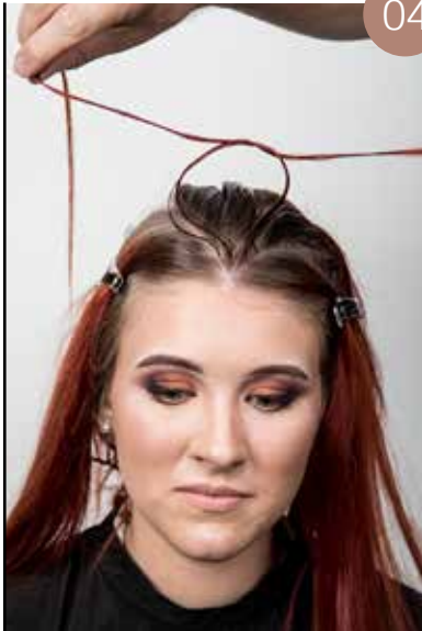
Neem een fijne verdeling in de zone vooran en maak een knoop