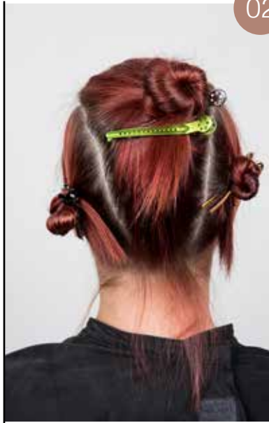
Deel de zijkanten af