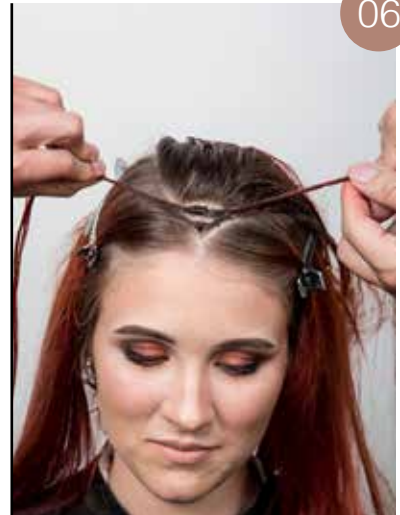
Neem een verdeling achter de eerste verdeling en maak een knoop samen met de eerste lokken. Doe dit voor de volledige verdeling