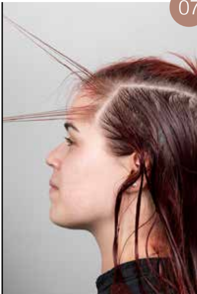
Neem een fijne verdeling aan de zijkant en maak een knoop