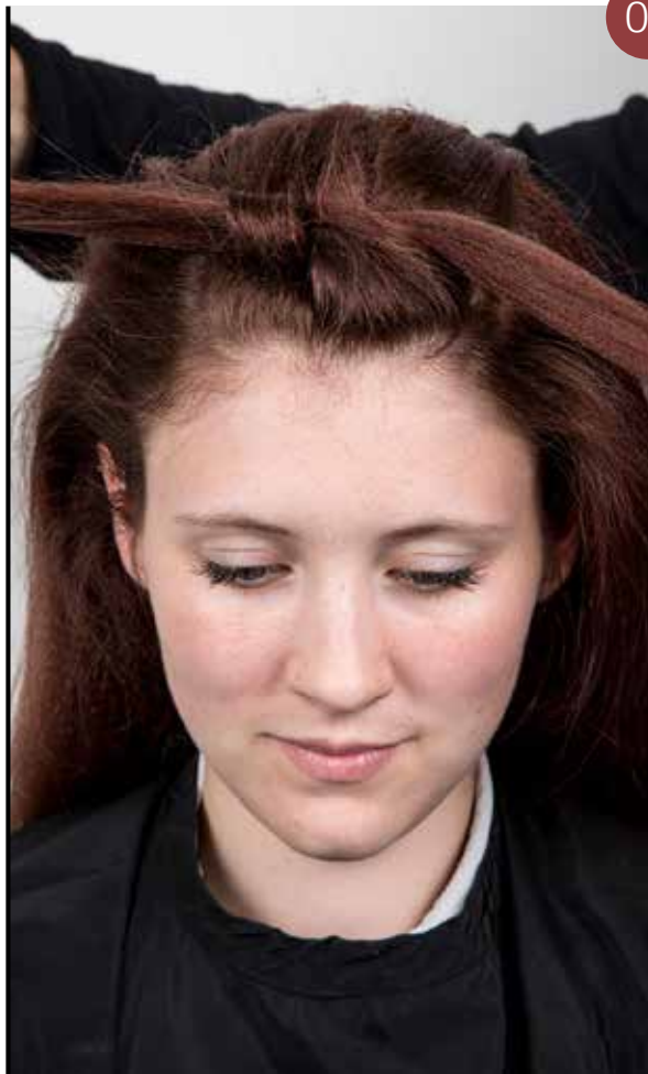
Creëer wafeltjes in het haar en maak grote knopen bovenaan het hoofd