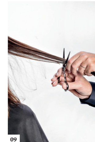
09 Knip zo verder terwijl je je verplaatst rondom de hele hoofdomtrek