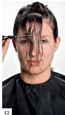
12 Maak een 2e rechthoekige scheiding van 4 cm dikte die parallel loopt met de 1e. Knip de pony ter hoogte van de wenkbrauwen zodat die heel natuurlijk valt