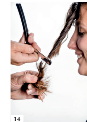
14 Snij ter hoogte van de lippen