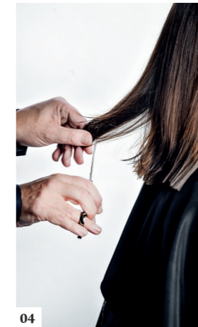
04 Neem een smalle verticale afdeling in het midden van de nek