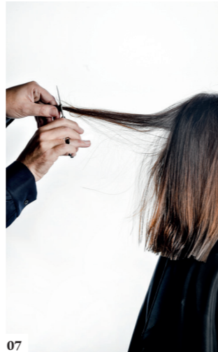
07 Houd dezelfde opwaartse beweging aan op elke verticale afdeling