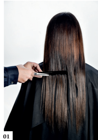
01 Kam de haren naar achter en bepaal de lengte onderaan de nek