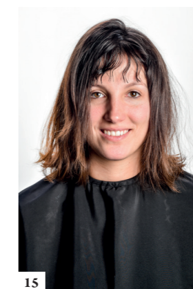
15 Zicht van de snit die heel soepel valt