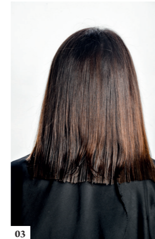
03 Knip zo verder naar elke zijde toe en volg een perfecte horizontale lijn