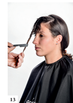
13 Maak de 2e rechthoek los, vorm een torsade richting kin en snij met een scheermes