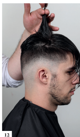
12 Knip op een lengte van ongeveer 7,5 cm