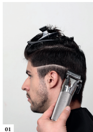
01 Maak een lijn met de tondeuse

KAPPER · GAETAN CHIIVARINI