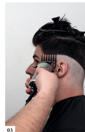
03 Plaats een breed opzetstuk op de tondeuse. Scheer het haar boven de lijn op een lengte van 4 cm.