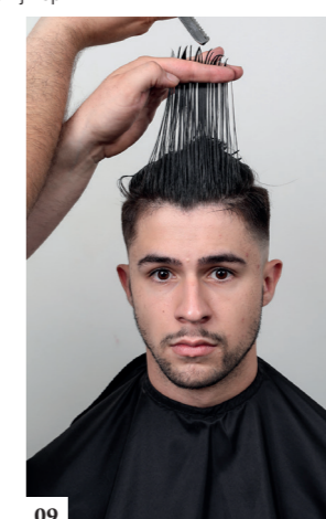
09 Voor de froufrou: neem een horizontale verdeling van 2 cm dik. Knip met de feather en behoud een extreme lengte