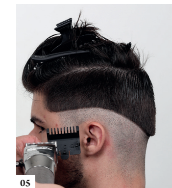
05 Plaats een kleiner opzetstuk op de tondeuse