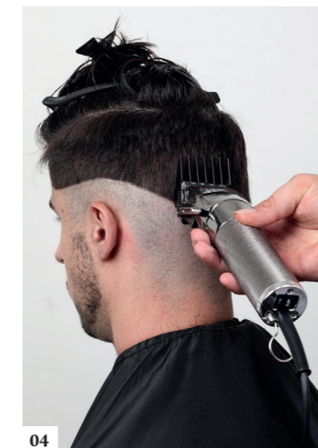
04 Idem voor de achterkant van het hoofd