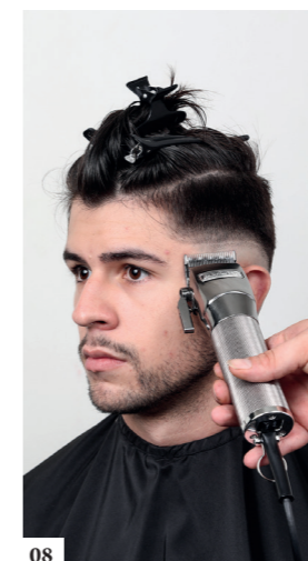
08 Scheer met de traditionele tondeuse (zonder opzetstuk) het haar in gradatie vanaf de lijn naar boven toe, dit over een hoogte van 1 cm