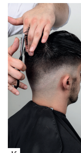
15 Neem een gidslijn mee vanop de kruin en knip elke verdeling van 2 cm dik.