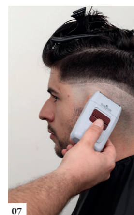
07 Scheer met een scheerapparaat de zone onder de lijn zo kort mogelijk (voor de volledige omtrek van het hoofd)