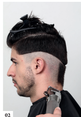
02 Scheer het haar onder de lijn met de tondeuse (zonder opzetstuk)