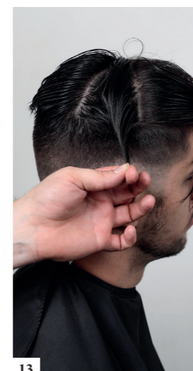
13 Neem driehoekige verdelingen (in de vorm van een halve maan)