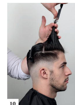
10 Maak de zone vooraan nat en knip met de feather in de haarmassa zodat het kapsel luchtiger wordt en de klant het makkelijker kan stylen