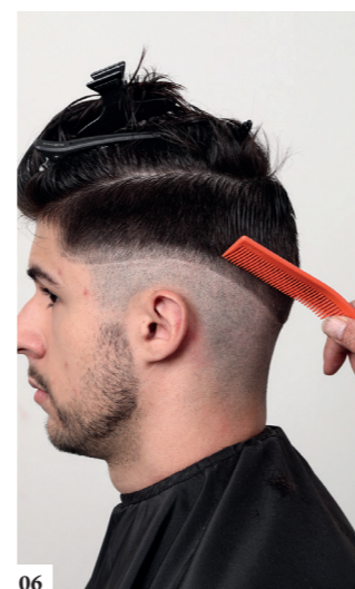
06 Ga na of alles nauwkeurig is afgewerkt. Werk bij indien nodig