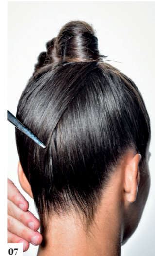
07 Let erop dat je beide kanten netjes over elkaar haalt