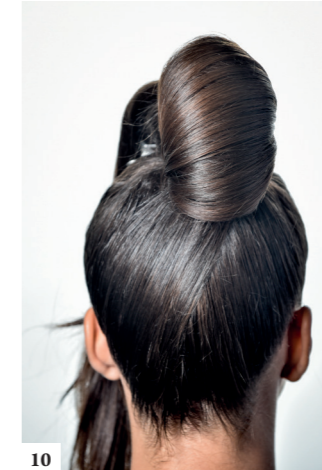
10 Let erop dat de rol netjes is afgewerkt en op de juiste plaats is vastgemaakt