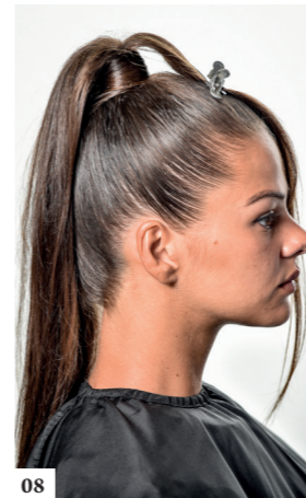
08 Trek een eerste lok en breng ze naar het voorhoofd. Verdeel de rest van de paardenstaart in twee gelijke delen, verdeel daarna één van de twee nogmaals in twee delen. Zonder de drie lokken af