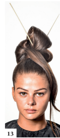
13 Werk op dezelfde manier voor de derde lok.