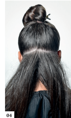
04 Maak een verticale scheiding in het midden van de achterste zone. Crepeer de haren van de 2 achterste zones aan de wortels