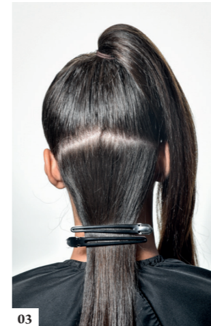
03 Nadat je het gecrepeerde deel open hebt getrokken en gesteild, maak je het vast 3 cm boven de kruin