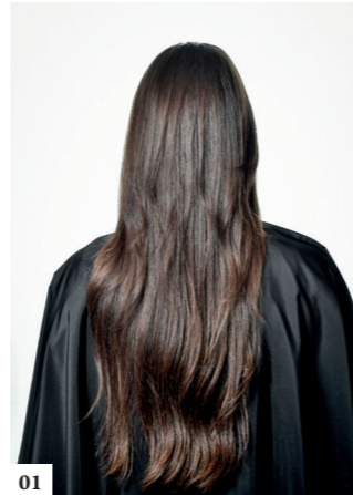
01 Voer een brushing uit: creëer volume aan de wortels, steil de lengtes en twist de punten