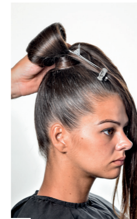
09 Crepeer en steil de eerste lok. Maak een rol