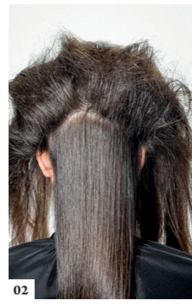
02 Maak een driehoekige scheiding van het achterhoofd naar de oren toe. Crepeer de zone bovenop het hoofd aan de wortels