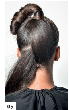
05 Breng beide achterste zones naar boven, steil ze en kruis ze in de richting van de kruin. Wind de punten rond het elastiek en maak ze vast met golvende haarspelden