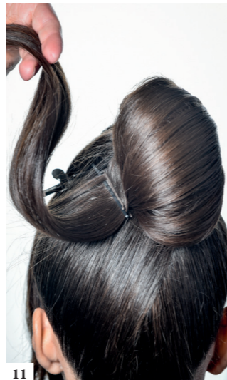
11 Nadat je de tweede lok hebt gecrepeerd en gesteild, steek je spelden aan de wortels om de rol te starten op een platte basis